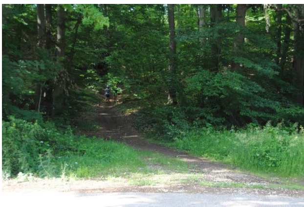
Standort für Tafel 1, Parkplatz an B 8